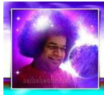
Sai Baba hier nog in de “goddelijke” hoogtijdagen

april). In deze kist werd de goeroe dan tentoongesteld na de officiële doodsverklaring op 1e paasdag (24 april 2011). Er zijn stemmen die zeggen dat Baba begin april reeds overleden is, maar dat de organisatie (die een miljardenbusiness in stand te houden heeft) in het kader van de mythevorming het beter vond om dit op Pasen te doen plaatsvinden (de opstandingsdag van Christus). 22