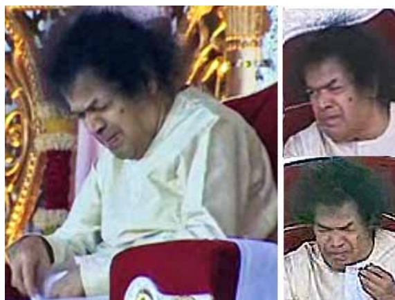
Hier recent bij 85e verjaardag zittend in een rolstoel wegens gebroken heup door een val. 23

De 20e eeuw heeft nog een hele serie andere Indiase goeroes gekend die min of meer met hun heilsleren velen hebben verleid (o.a. Mahesh Yogi en Bhagwan Sree Rajneesh oftewel Osho.) Van hen werd ook al gezegd : elke goeroe heeft een giro....Antroposofisch gezegd: Lucifer en Ahriman sluiten een bondgenootschap.