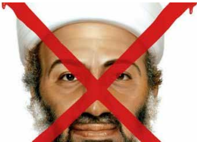
Times maakt dood bin Laden bekend

Voor hen die niet in toeval geloven, viel de bekendmaking van de dood van publieksvijand nummer één, Osama Bin Laden door president Barak Obama exact op dezelfde dag dat één van zijn voorgangers de dood van Adolf Hitler aankondigde, nl. 1 mei. Daar deed het blad 'Time' nog eens een schepje boven op door de dood van Bin Laden op dezelfde wijze in beeld te brengen als de dood van Hitler in hun nummer van 7 mei 1945: door middel van een rood kruis door het gezicht.