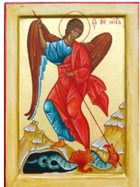
Michaël met draak