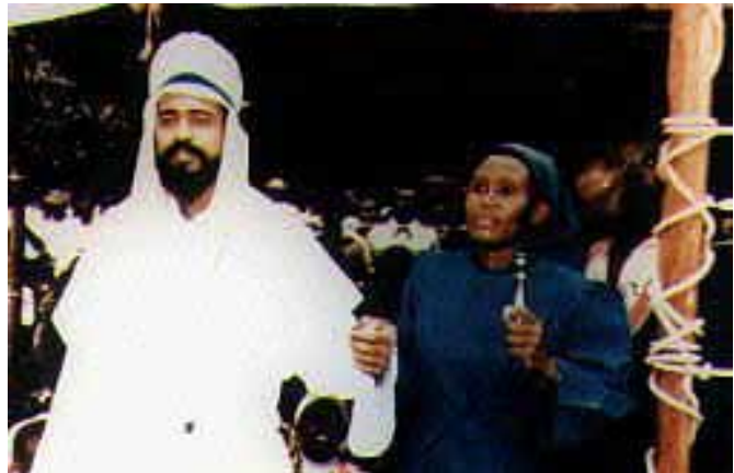
Hier een foto van een zogenaamde verschijning in Nairobi van Maitreya de Christus.

Creme presteerde het (jaren 80 vorige eeuw) om in de landelijke pers artikelen geplaatst te krijgen met de strekking dat Christus wedergekomen was en zich op dat moment in Londen bevond, waarop journalisten op pad gingen om daar een oosters ogende man met tulband op te gaan zoeken.