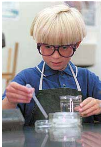
Toen (boven) als wonderkind en meer recent (beneden)

Ik geloof dat ik een speciale gave van God ontvangen heb en ik weet niet waarom, ik wil deze gave gebruiken om de gehele mensheid te helpen en duurzame wereldvrede te brengen.