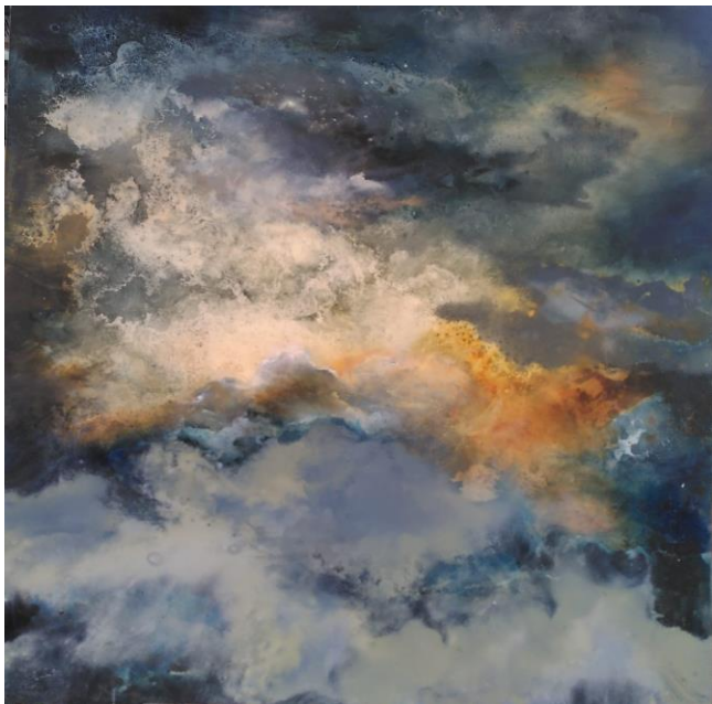
Andrea Schumacher - Clouds - ©2023

Administration/editing Roland Tüscher, Kirsten Juel. The responsibility for the contributions lies with the authors. *ENB12/22 © All rights reserved.